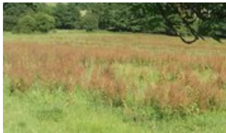
Prairie envahie par le rumex

En agriculture biologique, lorsqu'une parcelle est vraiment envahie d'adventices, la solution est la rénovation de la prairie. Pour le rumex, le seuil de nuisibilité est de 1 plante/5 m 2 ! Pour la rénovation, plusieurs techniques sont possibles selon le type de sol : avec labour ou par action mécanique superficielle. En bio, les techniques de faux-semis et de semis sous-couvert sont très recommandées et donnent de bons résultats en terme de maîtrise de la levée d'adventices. Ces pratiques s'appliquent également en conventionnel, le recours aux traitements chimiques devant rester dans tous les cas une solution ultime.