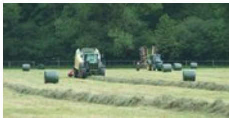
Récolte d'enrubanné par entreprise de travaux agricoles